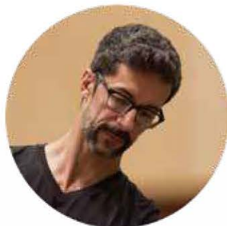
ジョゼ・マルティネス パリ・オペラ座バレエ 芸術監督