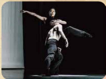
©Toss of a Dice by Jiri Kylian

ダンサーの活動に加え、様々な分野のアーティストとのコラボレーション、ミュージックビデオ出演やモデルなど幅広く活躍中。